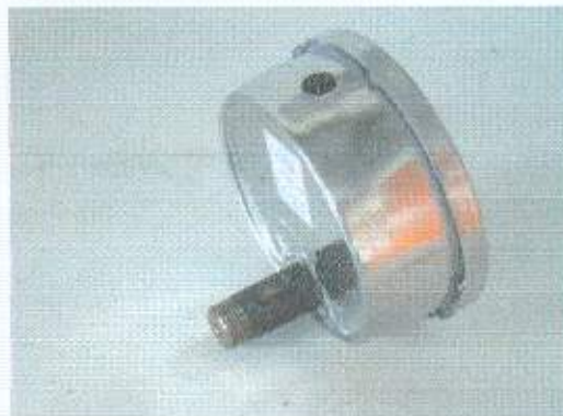
Figuras 1 e 2 – Manômetro PBIN 114 conexão traseira

Os resultados apresentados neste documento têm significação restrita e se aplicam somente ao item ensaiado ou calibrado. Este documento não dá direito ao uso do nome ou da marca IPT, para quaisquer fins, sob pena de indenização. A reprodução deste documento só poderá ser feita integralmente, sem nenhuma alteração.